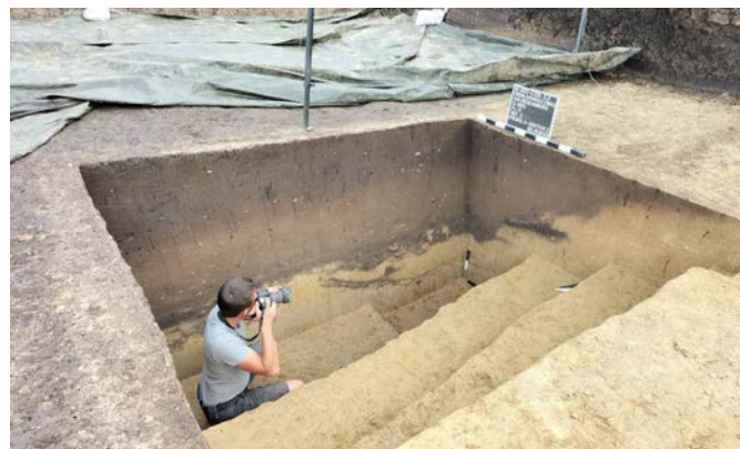
Grabungsarbeiten an einem Erdwerksgraben des 5. Jahrtausends in Mangolding im Jahr 2023.

Eines der interessantesten Ergebnisse der vergangenen Jahre ist die Entdeckung mehrerer jungsteinzeitlicher Grabenwerke, die einen hohen Organisationsgrad der Bevölkerung des späten 6. und der ersten Hälfte des 5. Jahrtausends belegen. Zu welchem Zweck die Grabenwerke angelegt wurden, mit denen bei großem Arbeitsaufwand Areale von mehreren Hektar Größe von der Umgebung abgetrennt wurden, bleibt dabei zunächst ein Rätsel.