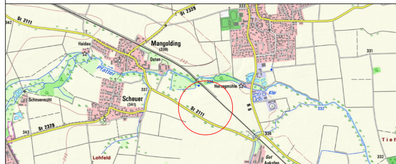
Übersichtsplan 1 : 25.000

Planunterlagen: Grundkarte erstellt von Ingenieurbüro Geoplan, Osterhofen, auf digitaler Flurkarte der Bayerischen Vermessungsverwaltung. Untergrund: Aussagen über Rückschlüsse auf die Untergrundverhältnisse und die Bodenbeschaffenheit können weder aus den amtlichen Karten, aus der Grundkarte noch aus Zeichnungen und Text abgeleitet werden. Nachrichtliche Übernahmen: Für nachrichtlich übernommene Planungen und Gegebenheiten kann keine Gewähr übernommen werden. Urheberrecht: Für die Planung behalten wir uns alle Rechte vor. Ohne unsere Zustimmung darf die Planung nicht geändert werden.