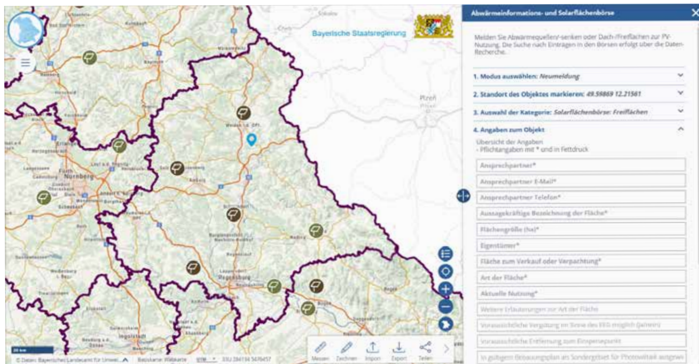
Solarflächenbörse mit gemeldeten Freiflächen im Regierungsbezirk Oberpfalz (Karte) und Eingabeformular für die Neumeldung einer Freifläche (Fenster rechts)

Über die Solarflächenbörse können Sie z. B. Ihre Dachfläche oder Ihr Acker- oder Grünland zur Errichtung einer Photovoltaik-Anlage anbieten. Umgekehrt können Sie nach geeigneten Dach- und Freiflächen für Ihr Vorhaben suchen. Aktuell sind über 70 Flächen in der Solarflächenbörse enthalten.