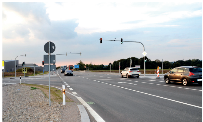
Text und Foto: Matok

Erschließung des angrenzenden interkommunalen Gewerbegebietes eingebaut werden. Bekanntlich errichtet dort der ADAC Südbayern derzeit unmittelbar an der B 8 und in Nähe der Autobahnausfahrt Rosenhof seine neue Fahrsicherheitsanlage. Auch der Landkreis Regensburg siedelt dort den neuen Kreisbauhof an. Für die Sicherheit entschloss sich das Staatliche Straßenbauamt für eine Ampelanlage anstelle eines Kreisverkehrs. Für die zahlreichen Lastwagenführer und Pendler, die aus den Gewerbegebieten Neutraubling und Rosenhof kommen, ist die Ampelanlage von der Kreisstraße R5 in die B8 eine wesentliche Erleichterung, besonders in den Morgenstunden.